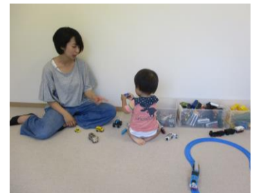
※実際の保育の様子

・申し込みの際に[お名前・ご連絡先]をお願いします。その際、保育をご希望の方はご相談ください。