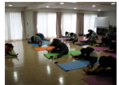
※コロナ以前のヨガの様子